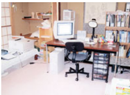
独立当初…事務所を借りるお金さえなく、部屋の一角を事務所代わりに…

1億円の借金を背負った私は、このような多額のお金を返済するには、自分で会社を興して成功するしか方法がないと思い独立を決意しました。しかし、それまでサラリーマンとして働いてきた経験しかないのです。商売の方法、儲ける方法なんて全く知りませんでした。