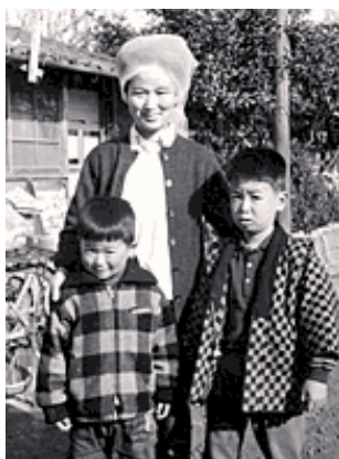
父親は蒸発…母親の女手ひとつで育った…

私は、貧しい家で育ちました。父親は私が9歳の時に蒸発し、私と私の兄は母親の女手ひとつで育ちました。家にはいつもお金がありませんでした。