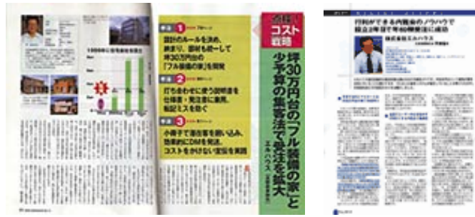
マスコミ記事の一部