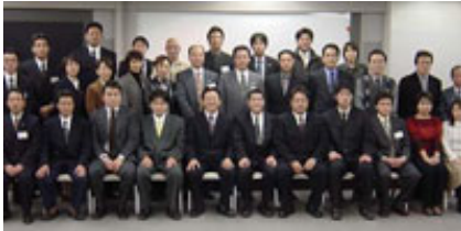
ローコスト住宅研究会メンバーの一部